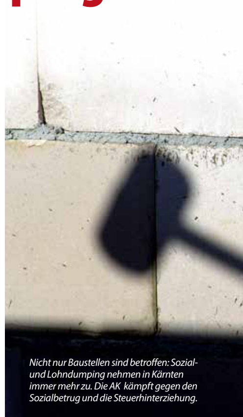
Nicht nur Baustellen sind betroffen: Sozial- und Lohndumping nehmen in Kärnten immer mehr zu. Die AK kämpft gegen den Sozialbetrug und die Steuerhinterziehung.