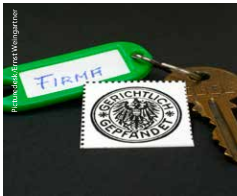
Insolvenzverfahren sind sehr komplex – die Rechtsexperten vom Insolvenzschutzverband sichern Ansprüche.

Im Konkursfall müssen betroffene Arbeitnehmer die richtigen Schritte setzen. Der Verband ISA hilft AK-Mitgliedern kostenlos.