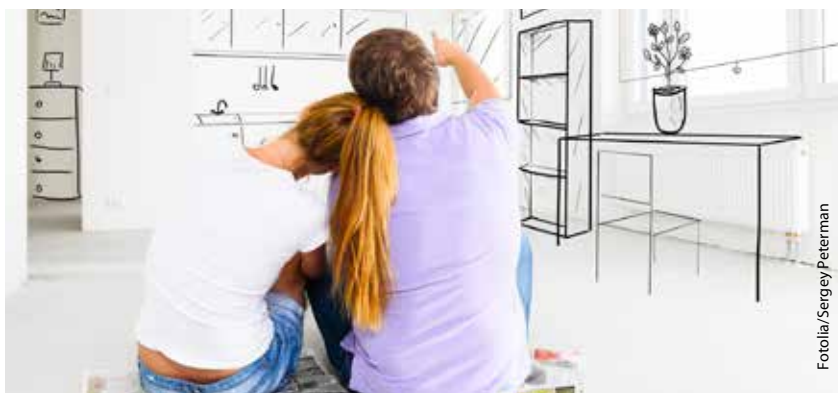
Damit die ersten Wohnräume wahr werden: Die AK hilft mit einem Darlehen.

Arbeitnehmer bis zum 35. Lebensjahr werden mit zinslosem Wohnbaudarlehen unterstützt.