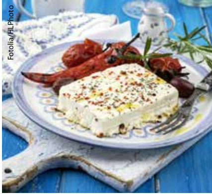
Alles Käse: Die griechische Spezialität Feta besteht oft zu mehr als einem Viertel aus Fett.

VKI-Test: In Salzlakenkäsen steckt oft mehr Salz als auf der Verpackung angegeben.