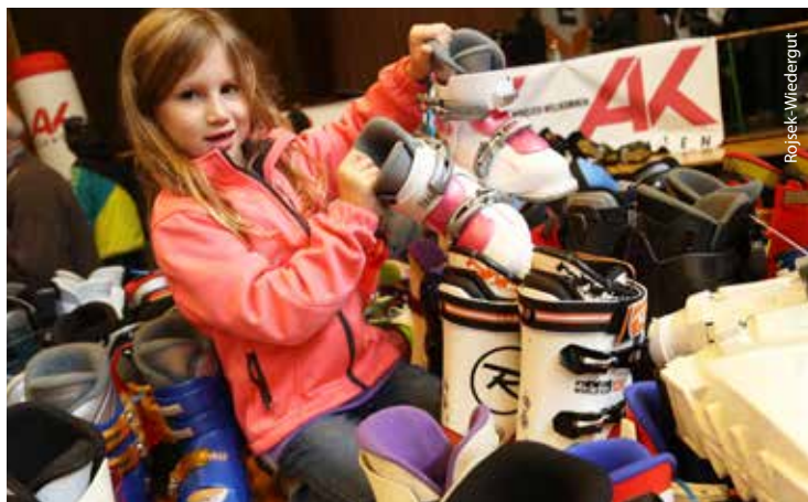
2015 veranstaltet die Arbeiterkammer Kärnten bereits zum 21. Mal die Wintersportbörsen. Der Erfolg ist ungebrochen - Tausende Besucher erfreuen sich am breiten Warenangebot.

Die Zeit vergeht wie im Flug und bald steht der Winter wieder vor der Tür. Zeit für die traditionellen AK-Wintersportbörsen, Kärntens größte unentgeltliche Plattform für gebrauchte Sportartikel. Alles, was man für Kinder und Familie zum Sportvergnügen in der kalten Jahreszeit braucht, kann man bei den AK-Sportbörsen kaufen und verkaufen. Das sind die