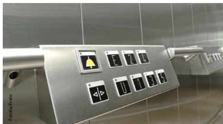
Die AK Kärnten achtet auf einen barrierefreien Zugang zu ihren Gebäuden - und hat dafür im Sommer von einer Kärntner Regionalzeitung ein gutes Zeugnis ausgestellt bekommen.