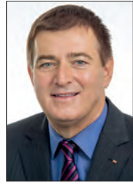
Günther Goach Präsident der Arbeiterkammer Kärnten